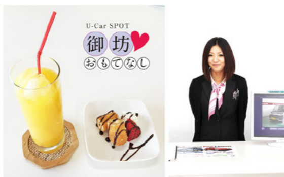
今月4月からおもてなしをする飲み物やお菓子。

U-Car SPOT 御坊 〒644-0011 御坊市湯川町財部70-4 (0738) 52-5111