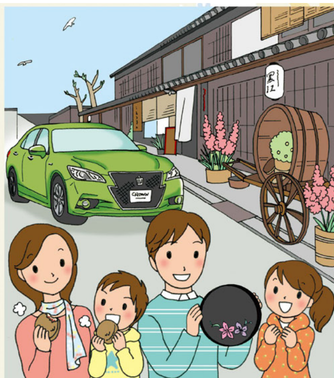
イラスト:マツカワチカコ