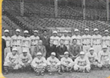
●大阪タイガース誕生(S10年)