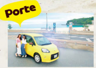
今回は大開口スライドドアのとっても便利なポルテでドライブしました。

海にレジャーに グルメ、温泉まで！ 夏と言えば海！今回のドライブでは、和歌山屈指のリゾートエリアでもある白浜をご紹介します。 昨夏に紀勢自動車道の「南紀白浜インター」が開通し、アクセスがますます便利になった白浜。まずは、真っ白なビーチがまぶしい白良浜で、目の前に広がる海を満喫します。続いて、隠れ家のようなカフェで美味しい料理と開放的な景色をのんびり堪能。そして、パンダやイルカを間近に見られるアドベンチャーワールドで大はしゃぎ！さらに海岸沿いの絶景ポイントや、白浜温泉&海鮮グルメ、おすすめの宿泊スポットまで、めいっばい白浜を楽しむことができます。 この夏は家族旅行はもちろん、友達同士やカップルで白浜を遊び尽くしてみませんか。