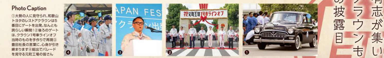
Photo Caption ①大勢の人に見守られ、和歌山トヨタのレストアクラウンは5番目にゲートを出発。なんとも誇らしい瞬間！②後ろのゲートは、クラウン1号車ラインオフ当時のものを手作りで再現③豊田社長の言葉に、心身が引き締まります④総出でパレードを見守る元町工場の皆さん

和歌山トヨタが、昨年からチャレンジしてきた「初代クラウンのレストア(※)プロジェクト」。「創業者の精神を学び、クラウンが持つ「トヨタの原点」としての魂を次代に継承していきたい」。その思いから、あえて難しい初代クラウンのレストアに挑み、スタッフが交代で作業に携わって、ようやくこの夏、夢がカタチとなって実現しました！ 約1年かけて復活したこの和歌山トヨタの初代クラウンは、「CROWN JAPAN FESTA」でお披露目されました。8月25日、歴代クラウンを製造し続ける愛知県豊田市の元町工場に、全国各地のトヨタ販売店から初代7代のレストアクラウンが54台も集結。この日は、トヨタ自動車社員、販売店社員、メディア関係者など約3000人が詰めかけ、盛大なセレモニーが開催されました。ここで、全54台が工場内を華々しくパレード走行。さらに、26台が東京まで約430kmの道のりを走破する新たな挑戦へ旅立ちました。蘇った雄姿たちが、公道を走り抜けて