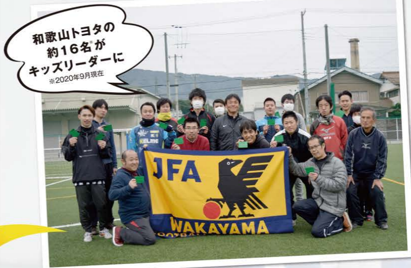
和歌山トヨタの 約16名が キッズリーダーに ※2020年9月現在

スポーツの力で活気ある和歌山に!! キッズサッカー巡回指導から今後は大会やイベント協賛も