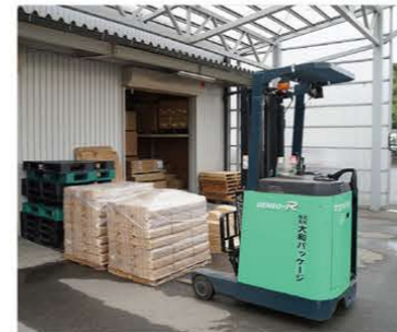
【写真上】色も形も素材も多種多様なパッケージがずらり。私たちがお店で日常的に見かける商品パッケージもたくさんあります。【写真下】敷地内にある工場では、和歌山トヨタグループのI&Fのフォークリフトが活躍中!